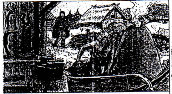
Les forgerons gaulois savent travailler le fer pour fabriquer leurs outils.

Les Gaulois accompagnent tous leurs repas de pain : il est tout doré et croustille bien sous la dent ! Et puis, surtout, ils boivent une sorte de bière : la cervoise. Légère et pétillante, elle est fabriquée avec des grains d'orge fermentés. Les jours de fête, elle coule à flots !